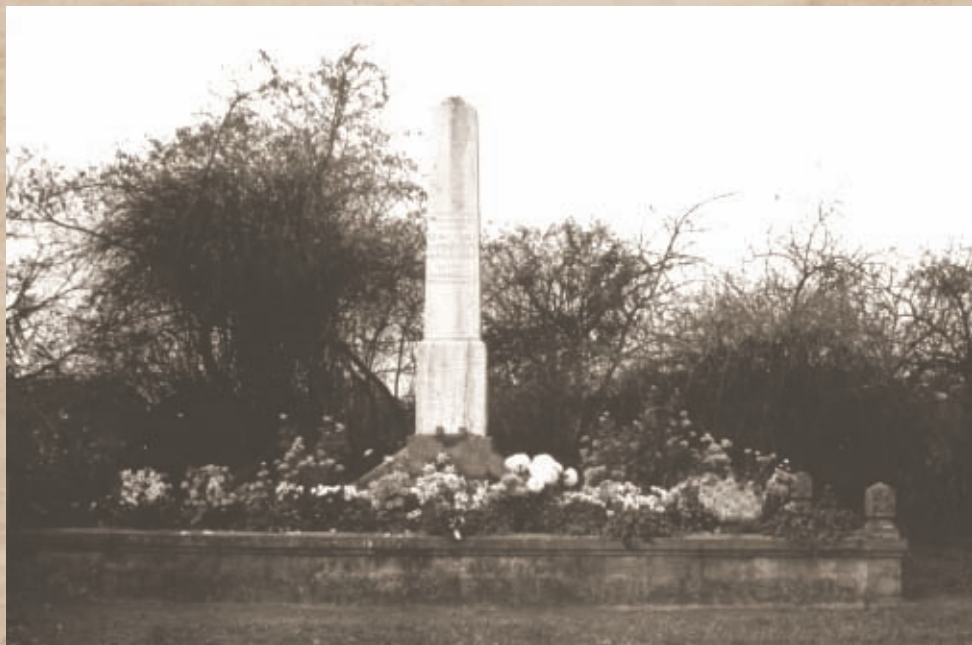
Az 1919-es emlékmű a 2000-es években

A megtorlás része volt, hogy állítólag közvetlenül Szamuely Tibor utasítására félmillió koronás hadisarcot vetettek ki a környék lakosságára. Bukovszky Jenő azonban más terhére róta a cselekményt: „[...] a hadisarcot Lévai vetette ki azzal az indoklással, hogy azok gazemberek voltak, mert a Tanácsköztársaság ellen mozogtak, s azért van szükség hadisarcra, mert az ő leverésükre a frontról kellett csapatokat elvonni, s így a szerbek egy újabb területet megszálltak, ahonnan sokan menekülnek, s az okozott kár megtérítése fejében kellett a károkozók ellen fellépni. A hadisarcot Lévai a direktóriumi tagok bemondása alapján vetette ki, s jellemző, hogy Lévai csak 300.000 korona hadisarcot vetett ki Kiskőrösre, de a direktóriumi tagok bemondásai alapján ezt az összeget 500.000 koronára emelte fel [...]. 52 Ezt részben rekvirálásokkal, részben a kihallgatott, ám súlyosabb büntetésre nem ítélt letartóztatottaktól szedték be. A teljesség igénye nélkül közlünk néhány adatot. Mendelényi János tanítót például 20 000 koronáért engedték szabadon. Viszonyításképpen megemlíttette, hogy ez az összeg tanító