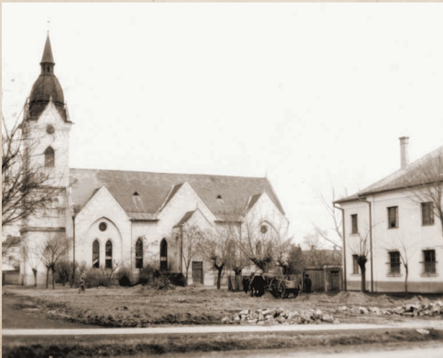
Talajjegyvetési munkák az ötvenes évek végén a templom és az imaház környezetében

ki hivatal dolgozói jegyzőkönyvet vettek fel, ebben pedig részletesen megörökítették tiltakozó jegyzéküket az imaház államosítása ellen. Kiemelték, hogy a nevezett 'kultúrház' voltaképpen imaház, kulturális szerepet önmagában sohasem töltött be, ellenben „[...] a több mint 10 ezer fős homogén evangélikus gyülekezet [...] számára meglévő temploma kicsinek bizonyult. Ezért a gyülekezet már 1817 óta jegyzőkönyvi bizonyágok szerint tervezi a második templom felépítését.” 27 A cikk elején hivatkozott 1817-ből származó dokumentum tehát újra előkerült, egy nem várt időszakban, mintegy legitimáló funkcióval. Azonban a küldöttség tagjai azt is kiemelték, hogy az 1949-ben használatba vett imaház valóban ebben a minőségben létezik: „[...] van és volt minden vasárnap két istentisztelet, minden vasárnap este úrvacsoraosztás, bibliaóra, imaóra, és hétköznapi istentiszteletek.” 28 Az érvelés során azonban