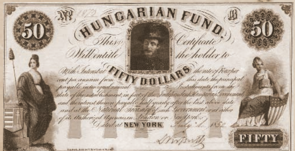
Kossuth Dollár (Internet)