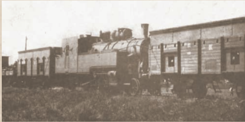
A IX. számú páncélvonat 1919-ben. Ehhez hasonló szerelvényvel érkezhettek Kiskőrösre a vörös különítményesek (Vasúthistoria Évkönyv 1989. 499. o.)

kellett ismernie, ám némileg azért igyekezett 'árnyalni' a képet: „[...] az egész mozgalomban résztvevők jó része félrevezetett, leitatott, nincstelen proletárok, földhöz ragadt szegény emberek voltak.” 5