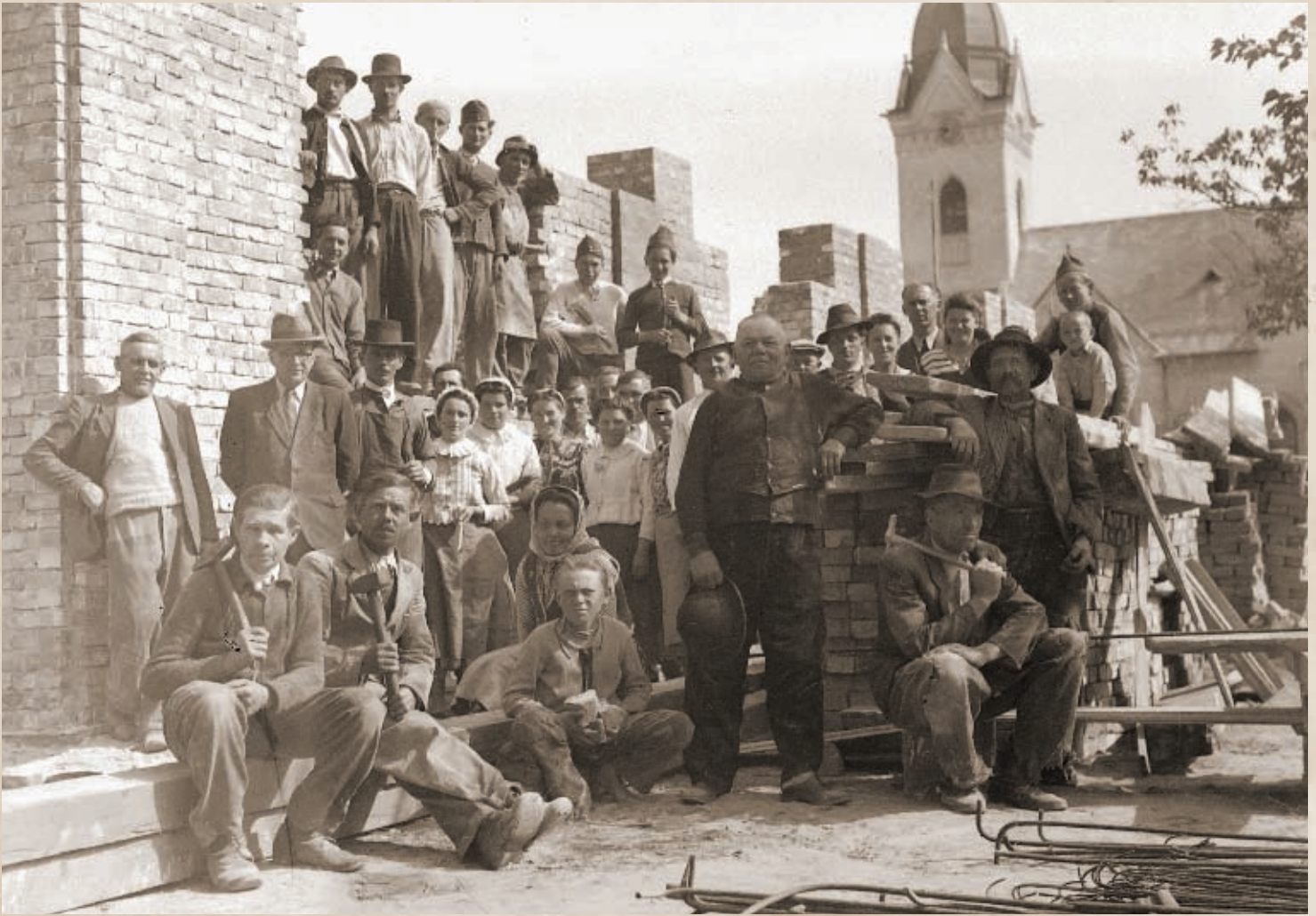
Épül az evangélikus imaház 1948-ban