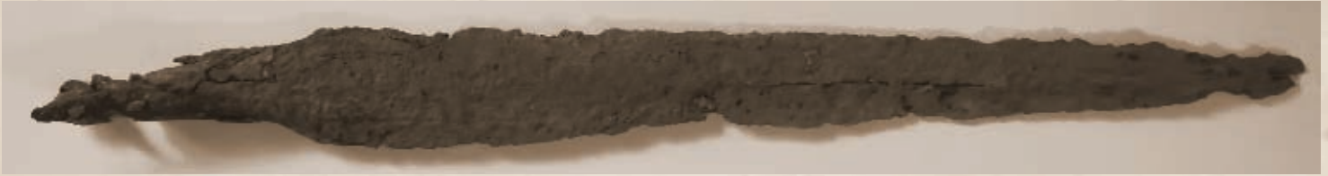
Kiskőrös határában előkerült középkori lándzsahegy (PSVK HGY)