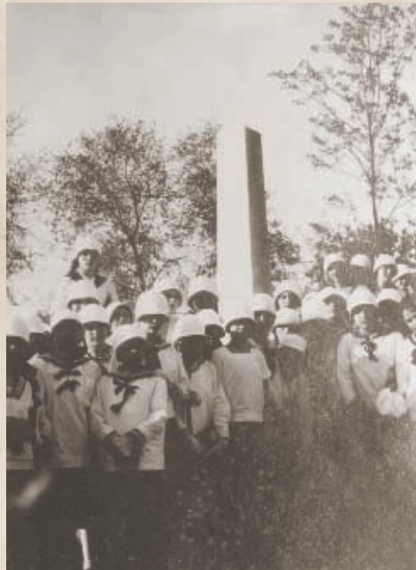
Budapesti kiránduló iskolások az 1919-es vértanúk emlékművénél 1929-ben