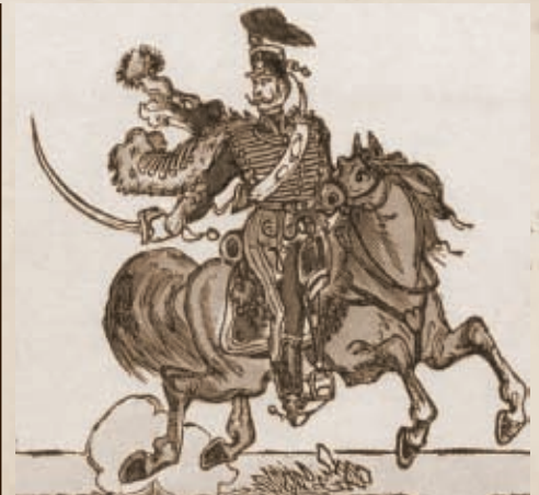
Francia lovas huszár