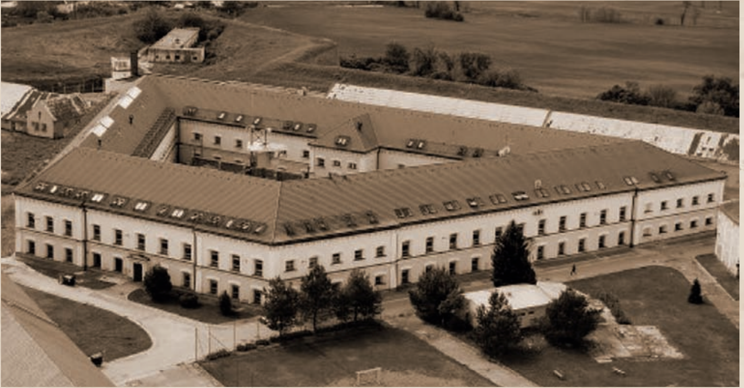
A Lipótvári börtön napjainkban (Internet)

nyult. Kiemelték vele kapcsolatban, hogy vasárnaponként is „nagyon szépen prédikált“, ünnepélyek alkalmával, előkelők temetésénél valósággal elbűvölte hallgatóit úgy, hogy nem csak ott helyben lakók tódultak hozzá a templomba, hanem egészen le a Szerémség túlsó határáig vitték a híret, sőt néha őt magát is, ha valaki, vagy valami dicsőítésére remek szóoklaltal akartak megemlékezni. Hatalmas lendülettel fogott hozzá az evangélikus egyházközösség fejlesztéséhez. Hajnóczy 1810-től, hivatalba lépésének első évétől, 1814-ig, tehát 4 év alatt 2991 forintot és 53 krajcárt, továbbá 803 mérő búzát gyűjtött a templom építésére. 1814 és 1815-ben hatvankét mázsa vasat vett az egyházközösség 2010 forint, téglát 2336 forint, meszet 2533 forint értékben; a kőműveseknek 5080 forintot fizetett e két évben az egyházközösség és 1817 január 5-én a számadások lezárása alkalmával kitűnt, hogy rövid hat év alatt 40 220 forintot fordított a gyülekezet templomának fölépítésére. A templom tornya később, 1843-ban készült el. Sajnos a hatalmas energiával felépített templomot a szerbek a második világháború után lerombolták.