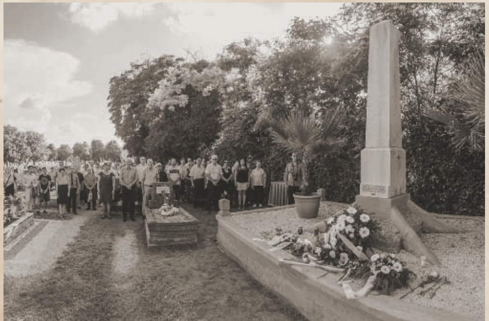
Az 1919-es vértanú emlékműve a 2019-es újraavató ünnepség végén

Érdekes adalék továbbá, hogy az államszocializmus éveiben az obeliszket elfordították, hogy a 'vörös rémuralom áldozatai' felirat ne legyen látható, valamint környezetét benőtte a zöld növényzet, sokak szerint ez mentette meg a biztos elbontástól. A kiskőrösi lakosság emlékezetében az oda temettek, és emlékünnepeik elhalványult, ám a népnyelv vértanúkként egy ideig tovább emlegette őket. Amikor azonban az 1990-es, és főként a 2000-es évektől valaki rákérdezett, hogy kiknek az emlékhelye is pontosan az a bizonyos obeliszket, néhány válaszó sajátos képet társított hozzá: az 'aradi vértanú' emlékművének nevezték. Akkorra ugyanis az egykori '19-esek kultusza már végképp kivészett a köztudatból, így ők más vértanút az aradiakon kívül megnevezni nem tudtak. 58