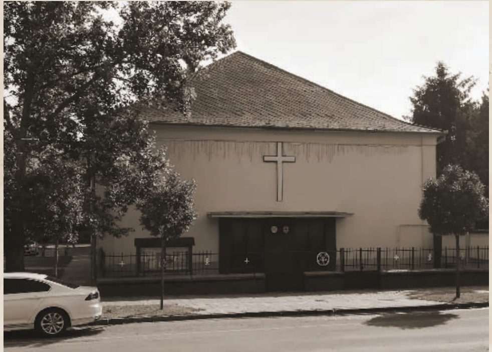
Az Evangélikus Imaház napjainkban

Az esemény háttérrel kapcsolatban érdemes megemlíteni, hogy ugyanebben az esztendőben a város földesurai [ti. a Wattyay-család örökösei, a Teleki, Okolicsányi-, Kubinyi- és Soós-családok] osztálygyejez-