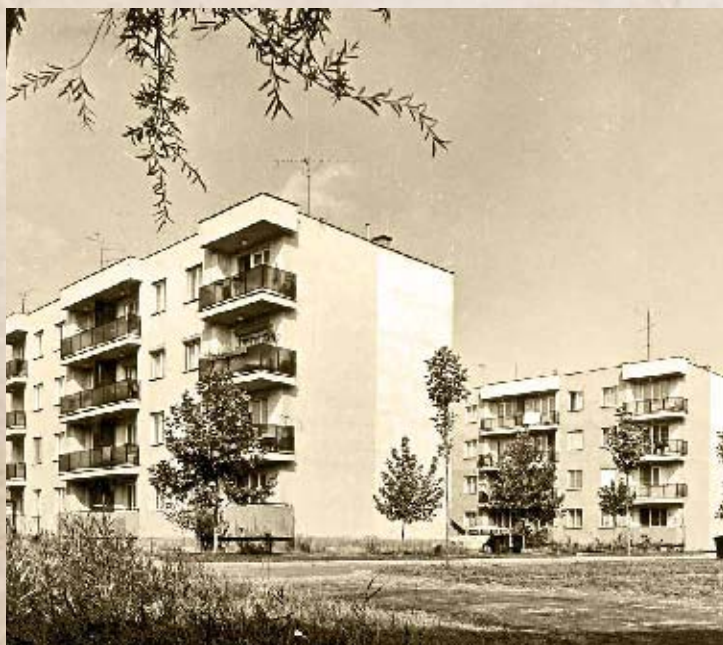
A Ligeti lakótelep társasházai I. (PSVK HGY)