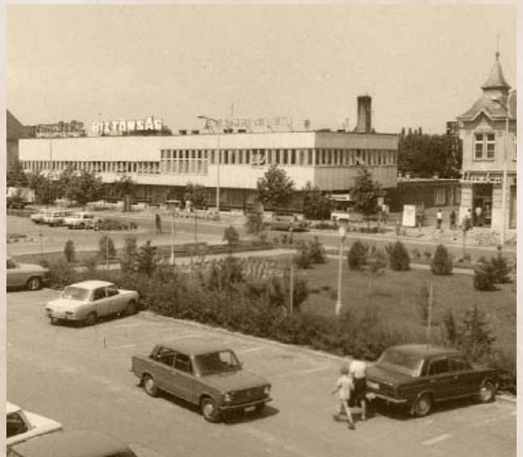
Kiskőrös központja 1976-ban (PSVK HGY)