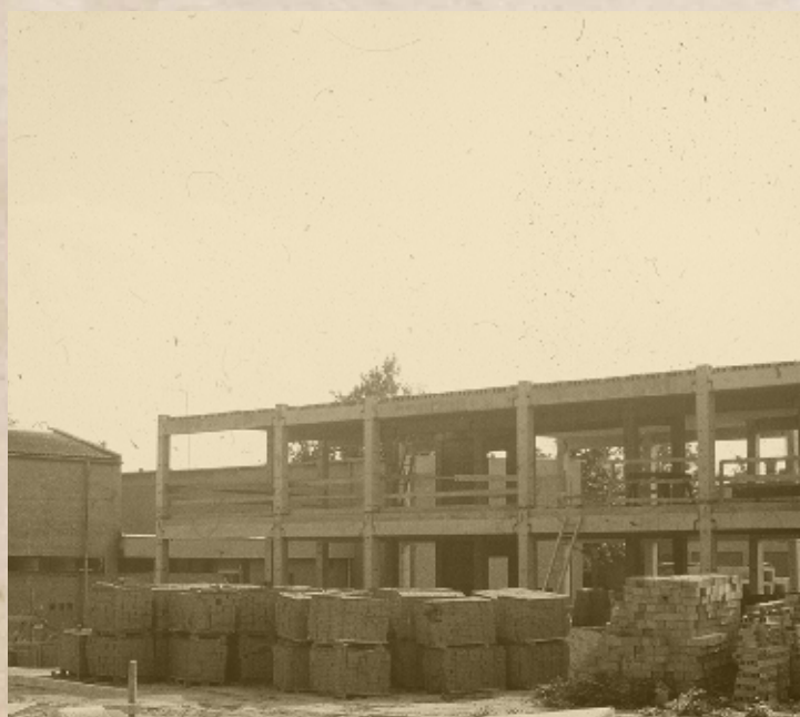
A Petőfi Általános Iskola bővítése 1985-ben (PSVK HGY)