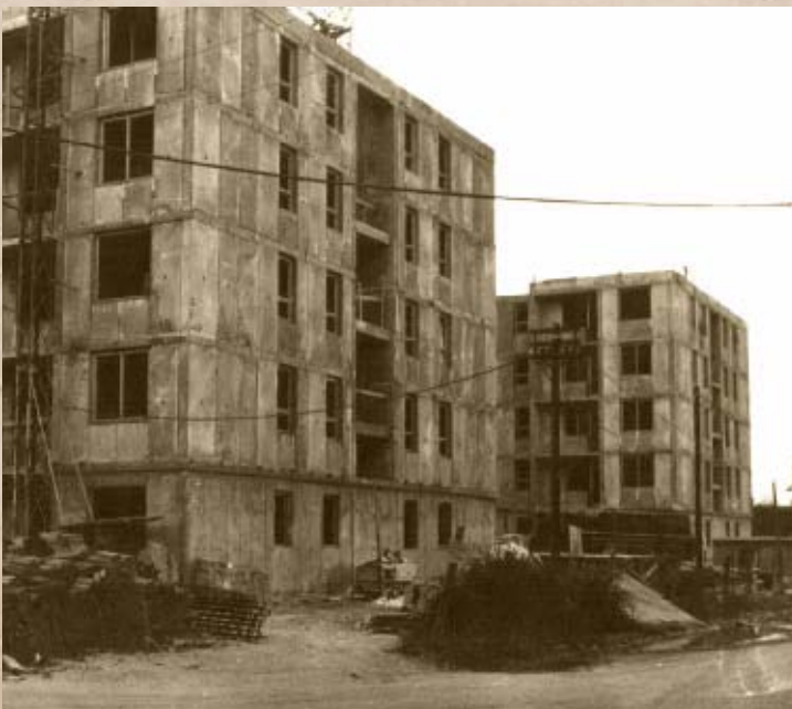
A Martini utcai társasházak építése (PSVK HGY)