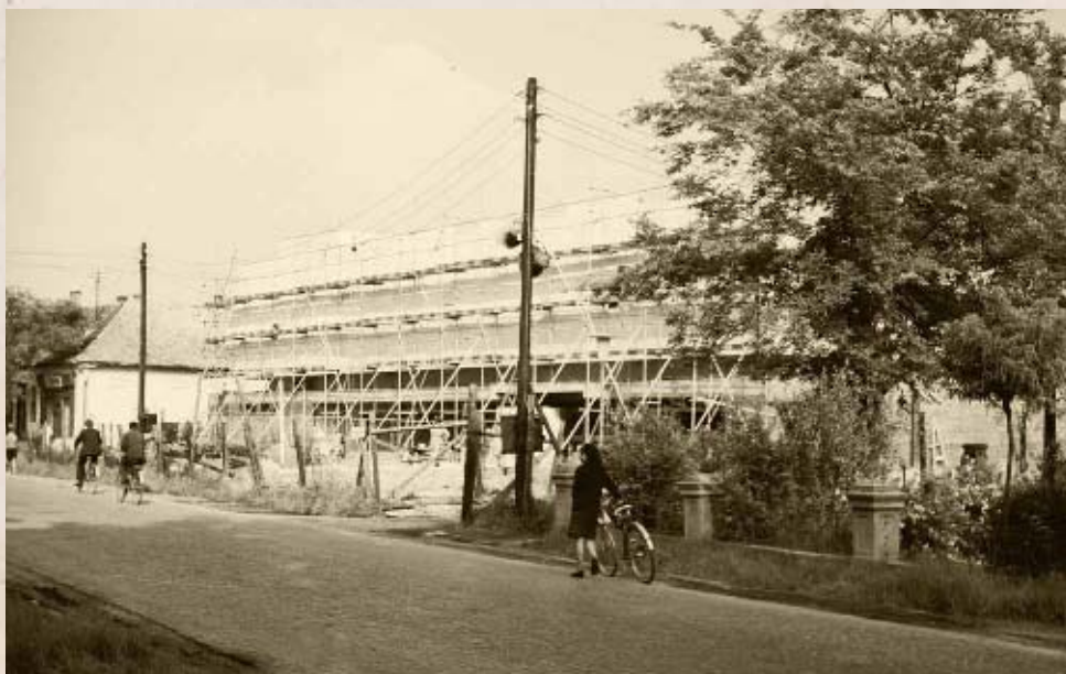
Épül az új szövetkezeti áruház a Kossuth utcában 1966-ban

A háborús károk helyreállításának döntő része még a negyvenes évek második felében megtörtént, 1952-ben új állomásépület épült, valamint teljes szakaszon megnyitották a Kecskemét-Kiskőrös keskeny nyomtávú gazdasági vasutat, amely az 1945 előtti vi-