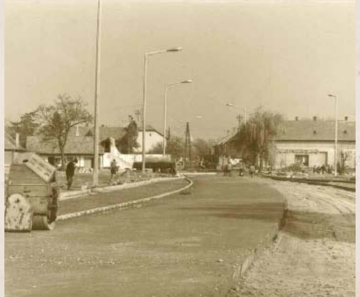
A Kossuth utca kiegyenesítési munkálatai I. (PSVK HGY)