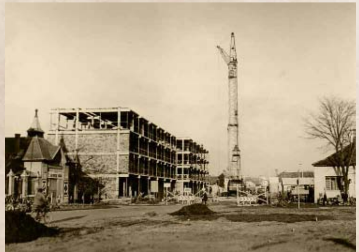
Az új „Bankpalota” és lakások építése 1975 körül (PSVK HGY)