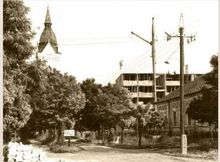
„Építkezés miatt az út lezárva” – hirdeti a tábla (PSVK HGY)