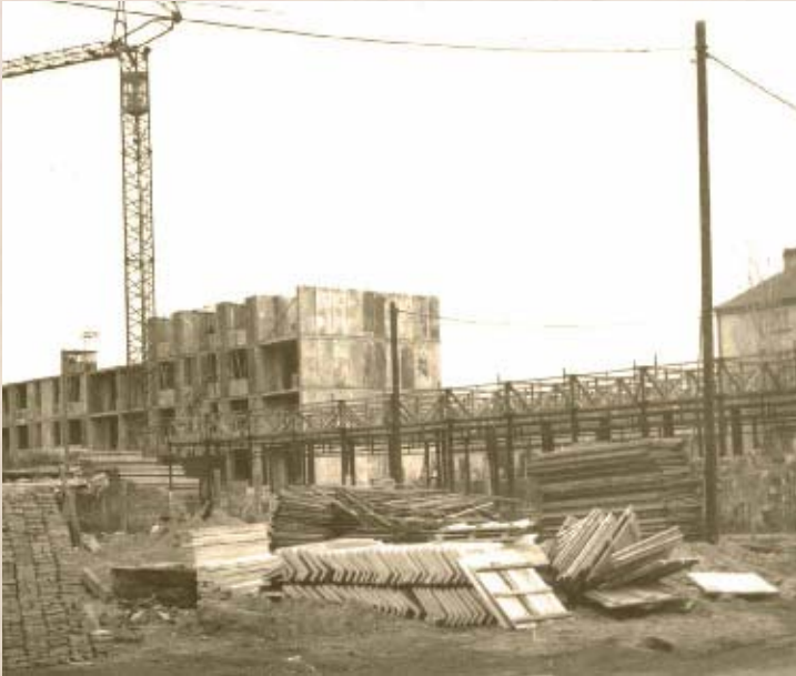
Épül az új Árpád utca (PSVK HGY)