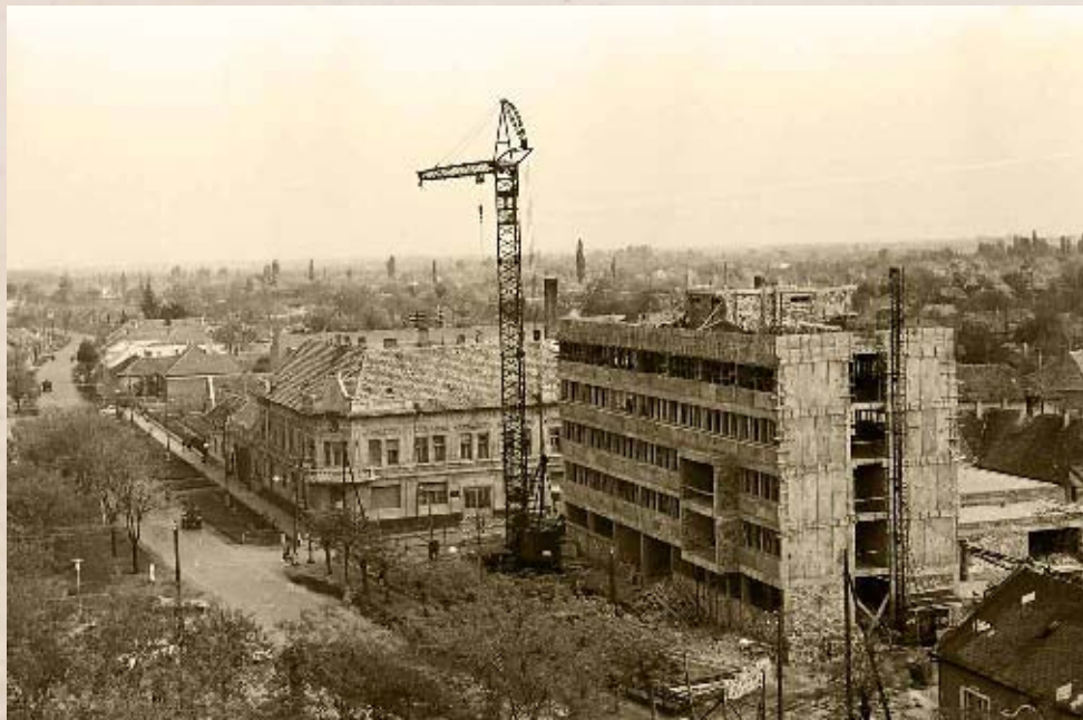
Az evangélikus iskola elbontását követően épül az MSZMP Járási Pártbizottsága és a járási hivatal székháza 1966-ban