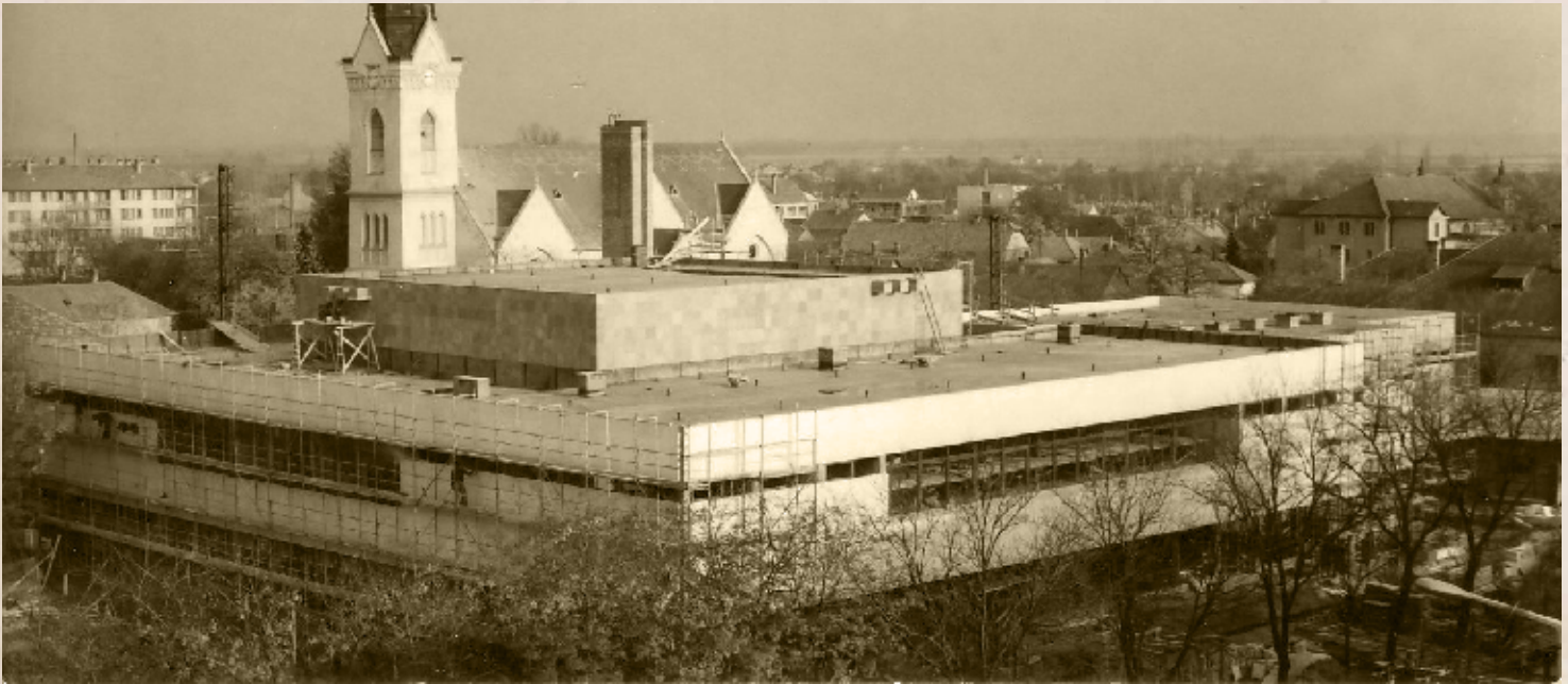
A Petőfi Sándor Művelődési központ építésének befejező munkálatai 1972-ben (PSVK HGY)

is adtak. Úgy is fogalmazhatnánk, hogy a Bács-Kiskun Megyei Tervező Vállalat építészete és a megrendelők alaposan túllőttek a célon, amikor az alább látható makettet elkészítették. A mai térre, és a szoborpark helyére újabb betonépületek, üzletsorok kerültek volna, a sétálóutcán pedig emeletes „toronyházat” terveztek. Petőfi Sándor szülőháza gyakorlatilag egy betonketrecbe szorult volna, funkcióját veszítve, időkapuszulaként „eltemetve”.