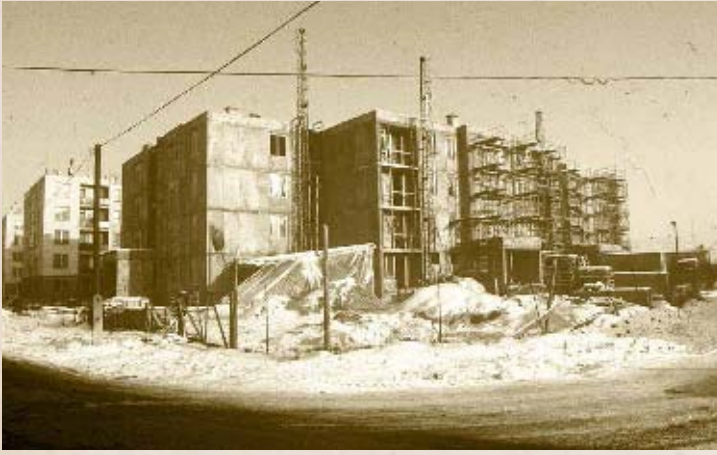
A Petrovics utcai társasház építése a nyolcvanas évek végén (PSVK HGY)