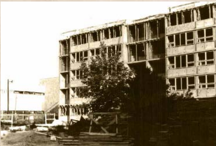
Az ún. „Bim-Bam ház” építése a könyvtár mellett a 70-es évek elején (PSVK HGY)