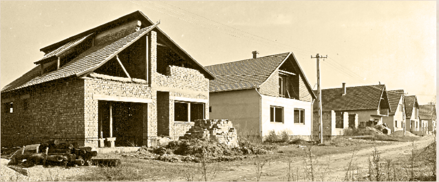
A Hruz Mária utca nyeregtetős családi házai a 80-as években (PSVK HGY)