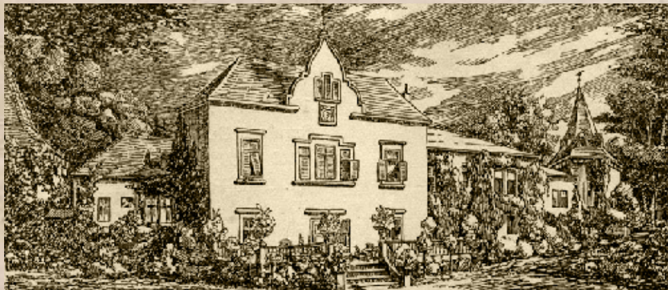
A bethleni Bethlen-kastély

Miként került sor Bethlen dunapataji jelölésére, arról keveset tudunk. Egy sajtótudósítás szerint 1892 januárjában dunapataji küldöttség érkezik Budapestre, és a kerület ellenzéke nevében képviselőjelöltet kér a Függetlenségi Párt és a Nemzeti Párt (ekkor már ezen a néven szerepelt a korábbi mérsékelt ellenzék) vezérlő bizottságaitól, akik ezúttal