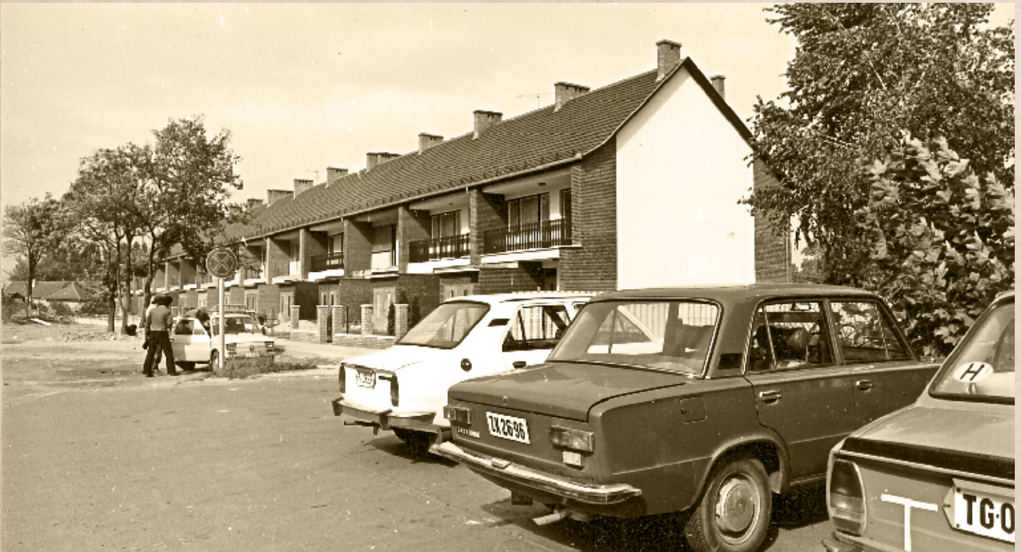
Az elkészült Klapka utcai sorház (PSVK HGY)