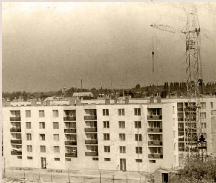
Épül az Attila utcai lakótelep II. (PSVK HGY)