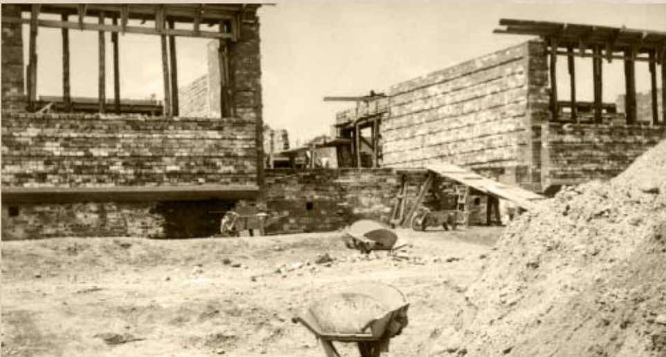
A Petőfi Állami Általános Iskola főhomlokzatának építése 1960-ban. Még a funkcionális épületek felépülése előtt egy nagy központi iskola építéséről döntöttek

Habár az 1972-es évszám jórészt benne él a helyi köztudatban, azt már sokan nem tudják, hogy ekkor tulajdonképpen Kiskőrös nem csupán elnyerte, hanem visszanyerte a városi rangot. Bő száz esztendővel korábban ugyanis a települést még mezővárosként tartották számon, ezt a címet II. József király idejében szerezte meg, egészen pontosan 1784. június 18-án. Ez a több kedvezményt is magába foglaló cím azután 1871-ben az úgynevezett községi törvénynek esett áldozatul (1871. évi XVIII. törvénycikk). 1 A Monarchia idején az államhatalom a községekre (ti. közigazgatási egység) alapozta az új polgári közigazgatási modelljét, ahol a városi cím elnyeréséhez nem csak a központi fekvés, a lakosság szám, de a település bevételei is jelentősebbnek kellett legyenek. Utóbbi híján Kiskőrös ebben a rendszerben nagyközség lehetett, bár ezt a korabeli polgárság igencsak nehezményezte. Jó példa erre a központi hivatalnak, a járásbírósnak és a jegyzőnek helyet adó