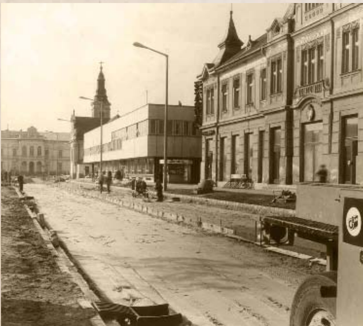
A Kossuth utca kiegyenesítési munkálatai II. (PSVK HGY)