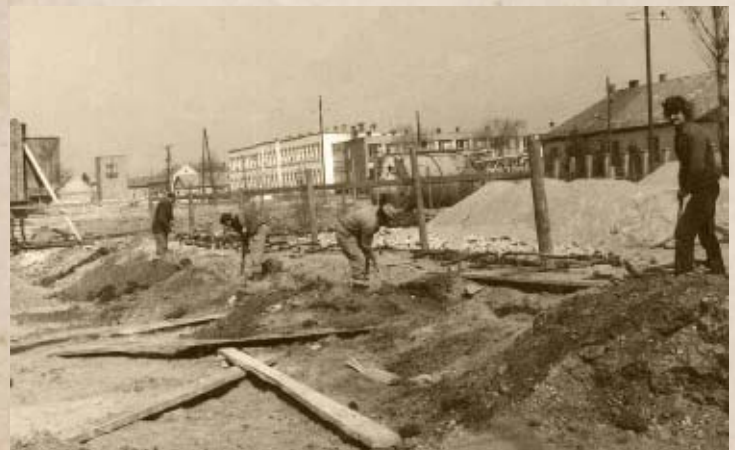
Bontják a régi Árpád utcát (PSVK HGY)