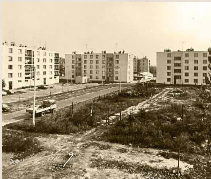
Épül az Attila utcai lakótelep III. (PSVK HGY)