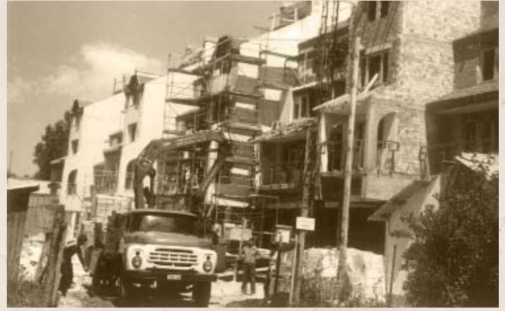
A Sétáló utcai társasház építése a nyolcvanas években (PSVK HGY)