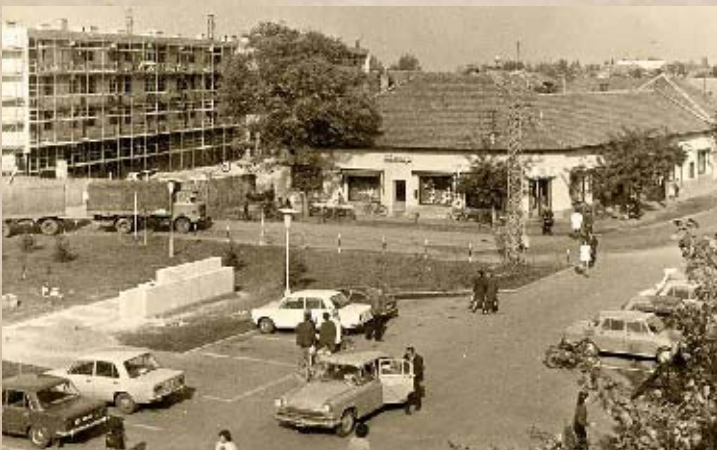
A régi és az új Kossuth utca arculata (PSVK HGY)