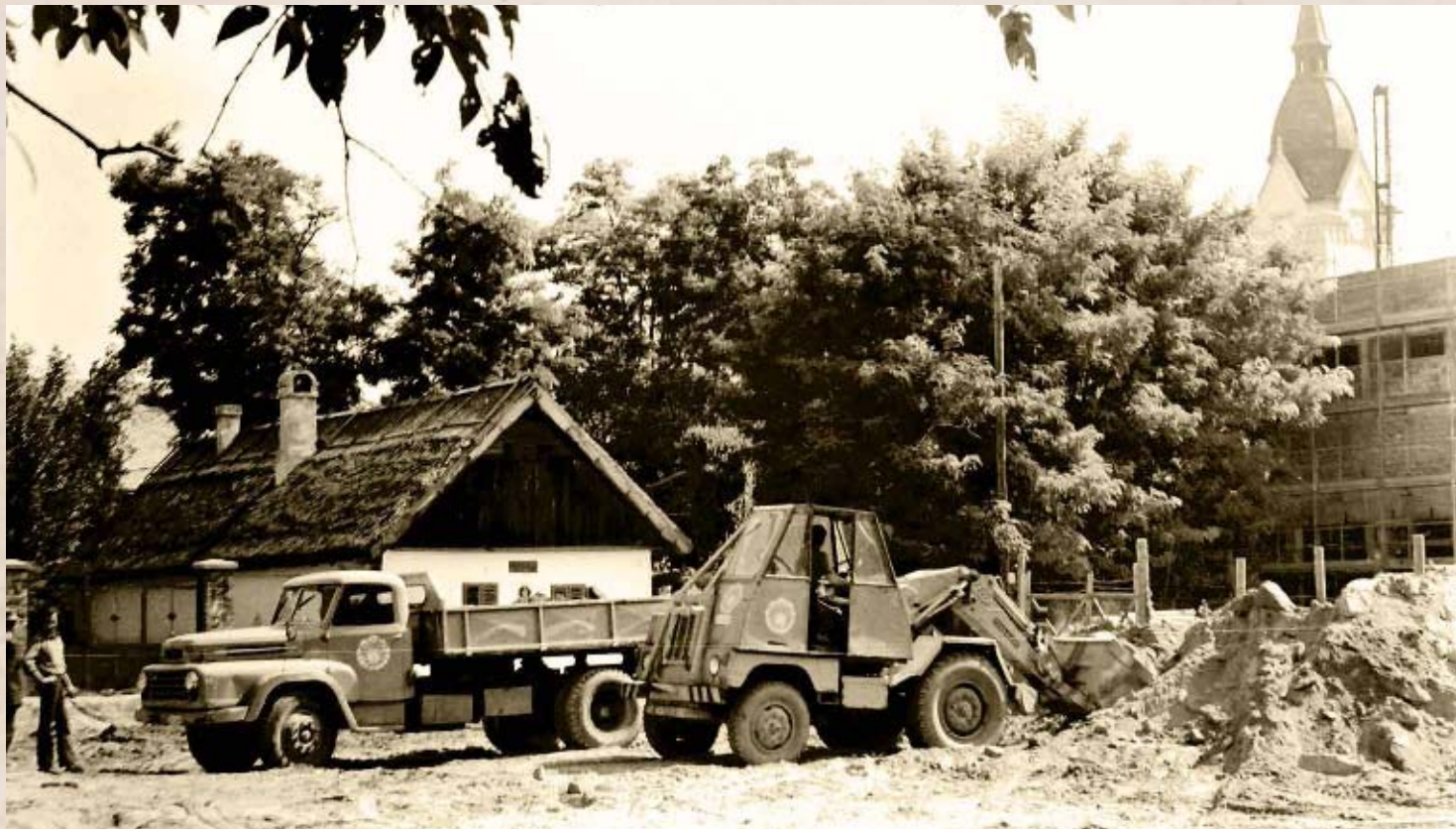
Térrendezés 1971-ben. Háttérben az épülő művelődési központ

építkezés már átcsúszott a hetvenes évek elejére. Eleinte új körzeti orvosi rendelő építése is tervben volt, ám végül a Kossuth utcában egy régi polgárházat jelöltek ki erre a célra. Néhány házzal feljebb így került kialakításra a mentőállomás is. 25