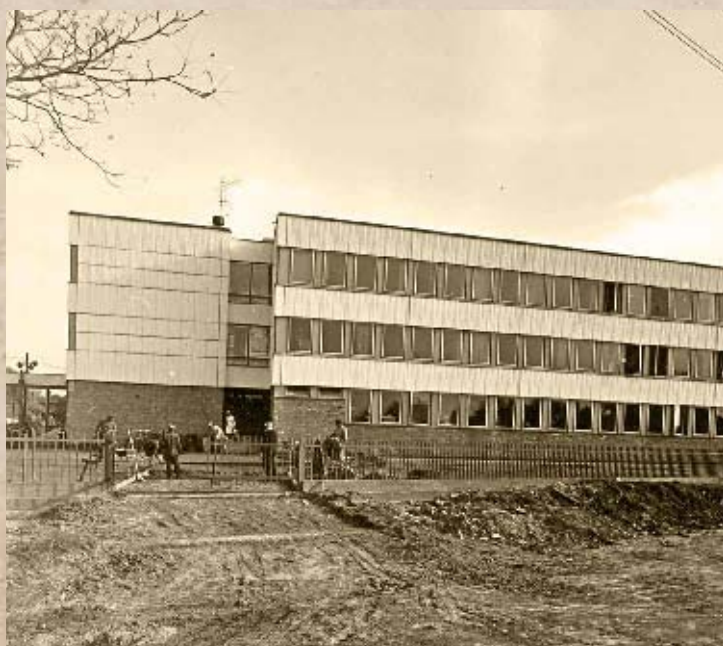
Az Új Iskola építésének befejező munkálatai 1980-ban (PSVK HGY)