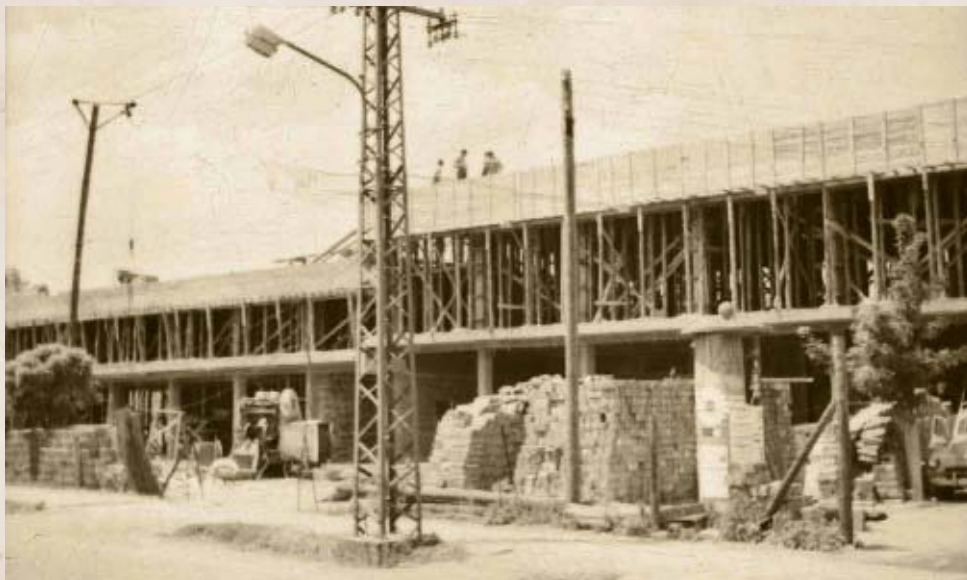
A postahivatal és biztosító iroda épületének munkálatai 1966-ban (Jankó Béla felvétele)

zépére megtörtént a két fő útvonal (Kossuth és Petőfi utcák) kikövezése kis kockakövel. 1935-ben a villanytelep tulajdonosa új mozgóképszínházat építtet a Városháza mögötti utcában. A korszak utolsó jelentősebb építkezése 1941-ben zajlott, amikor a Bajai Takarékpénztár építette fel székházát a Kossuth utcában. Csatornázásról, közművekről, infrastrukturális fejlesztésekről ekkor még nem beszélhetünk. Különösen feltűnő volt még az 1940-es években is a járdák szinte teljes hiánya. A lakáshelyzet semmit sem