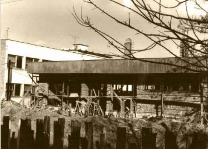
Épül a Patyolat Mosoda épülete a szolgáltatóház mögötti területen