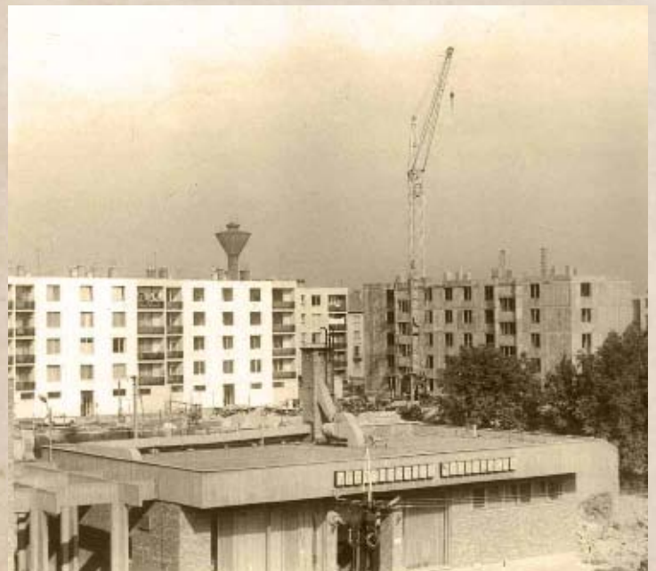
Épül az Attila utcai lakótelep I. (PSVK HGY)