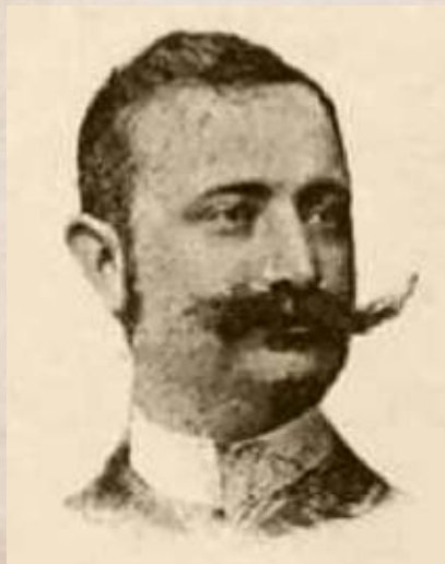
gróf Bethlen Gergely képviselő 1892-ben

Bár Mikszáth Kálmán a keceli választókörzetet nevezte végzetes kerületnek, a szomszédos, Kiskőröst is magába foglaló dunapataji kerület képviselője sem számított életbiztosításnak a dualizmus korában. Három hónata sem tudta kitölteni itt szerzett mandátumát. Vidats János, az egykori márciusi ifjú és gépgyáros 1873-ban gazdasági csődbe jut, és leveti magát egy pesti bérház emeletéről.