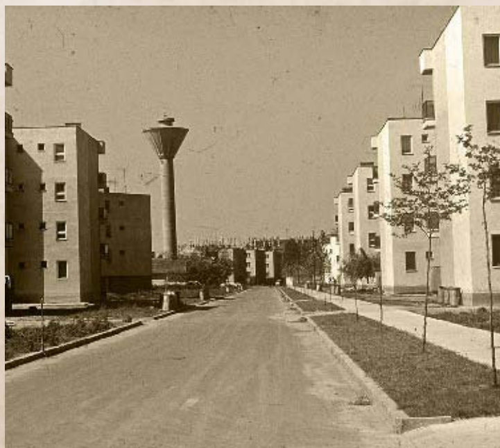
A Ligeti lakótelep társasházai II. (PSVK HGY)