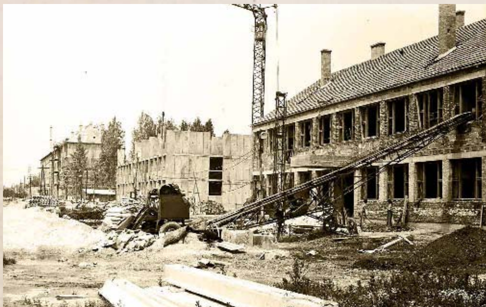
A 621. számú Ipari Szakmunkásképző és a kollégium építése 1969-ben (Lakos József felvétele)

Tölgyszéki, Haskó és Kudron házak helye, a Kossuth utca 11. és a gimnázium közötti terület, a Safáry utca és a Szent István utca közötti társasház helye, a Martini és Árpád utcák sarkán található ún. Pap-kert (ma élelmiszerüzlet található itt), valamint az Árpád utca és a Csányi utca sarkán található terület. Az egyes pontok esetében számításba vették a kisajátítási és bontási költségeket, ám végül nem ez bizonyult a legfontosabb tényezőnek, amiért is az iskola telke mellett döntöttek. Egy pártháznak a korszakban ugyanis, a korabeli vélekedés alapján, „központi helyen kellett lennie”. Ilyen helyen volt a jóval alacsonyabb presztízsű községi pártbizottság épülete, amely 1960 óta állt a közeli Csirkepiac téren. Ráadásul a tervek készítésénél eredetileg a régi Iparoskör épületét is eltüntették volna, hogy annak helyére egy ugyanakkora emeletes épületet húzzanak fel a tanács és szolgálati lakások céljára. Ez utóbbi valószínűleg anyagi okokból nem valósult meg. 19