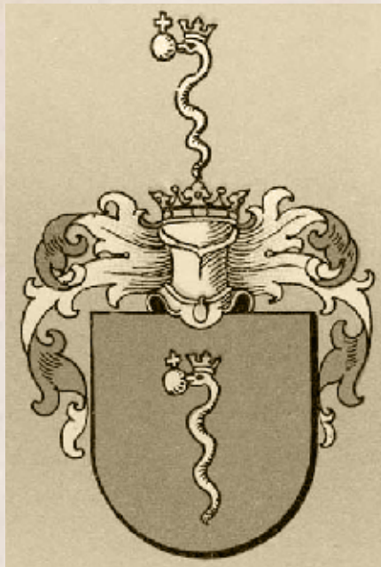
A bethleni Bethlen család címere (Internet)

amely szintén nem változtatna döntően Magyarország és Ausztria viszonyán, a fennálló keretek között próbálna a kormánypárt alternatívájává válni. Ennek az iránynak a magját zömmel a Deák-pártból kivált konzervatív arisztokraták alkotják, de idővel idecsapódnak a Szabadelvű Pártból ilyen-olyan okokból kilépett, sértett politikusok is. Az így felhígult konzervatívok egyesült majd mérsékelt